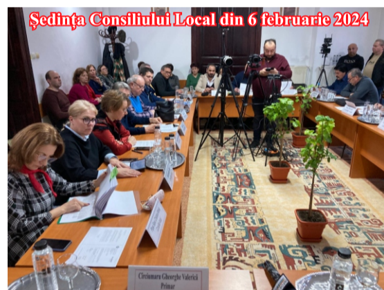
Ședința Consiliului Local din 6 februarie 2024

Motivația acestei creșteri este explicată de primarul municipiului: „De la data când am construit bugetul, astăzi (n.n. 6 februarie) au sosit și sumele aferente cheltuielilor pentru instituțiile descentralizate, în sumă de 3,4 milioane de lei. Așteptam această sumă, care