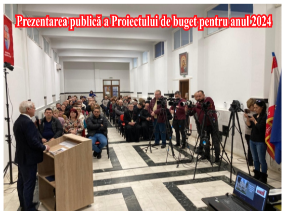
Prezentarea publică a Proiectului de buget pentru anul 2024

În timpul prezentării publice a proiectului de buget, desfășurată pe 1 februarie 2024, a prezentat o comparație pe ultimii cinci