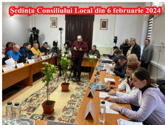
Ședința Consiliului Local din 6 februarie 2024

se referă la unitățile de învățământ, completând partea de venituri și cheltuieli. Zilele trecute, în baza unui Ordin comun (n.n. Ordinul nr. 3040/114/670/2024) al Ministerului Educației, Ministerul Sănătății și Ministerul Dezvoltării, Lucrărilor Publice și Administrației, a trebuit să procedăm la